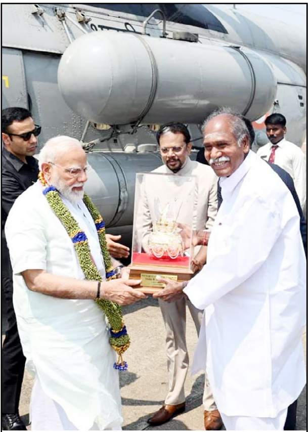
புதுச்சேரி வந்தடைந்தார் பிரதமர் மோடி. விமான நிலையத்தில் முதல்வர் ரங்கசாமி வரவேற்பு.

சென்னை: மார்ச் 2- முதல்வர் மு.க. ஸ்டாலினின் பிறந்த நாளை முன்னிட்டு அவருக்கு பிரதமர் நரேந்திர மோடி வாழ்த்து தெரிவித்துள்ளார். தமிழகம் வந்துள்ள பிரதமர் மோடி, முதல்வர் ஸ்டாலினை தொலைபேசியில் தொடர்பு கொண்டு பிறந்த நாள் வாழ்த்து தெரிவித்தார். மேலும் அவர் வெளியிட்டுள்ள சமூக ஊடகப் பதிவில், "முதல்வர் மு.க. ஸ்டாலினுக்கு பிறந்த நாள் நல்வாழ்த்துகள். அவர் நீண்ட ஆயுளோடும் நல்ல ஆரோக்கியத்தோடும் வாழ வாழ்த்துகிறேன்" என்று தெரிவித்துள்ளார். பிரதமரின் வாழ்த்துக்கு முதல்வர் தனது சமூக ஊடகப் பதிவில் நன்றி தெரிவித்துள்ளார். மத்திய பாதுகாப்பு அமைச்சர் ராஜ்நாத் சிங் வெளியிட்ட வாழ்த்துப் பதிவில், "தமிழக முதல்வர் மு.க. ஸ்டாலினுக்கு இனிமேல் பிறந்த நாள் நல் வாழ்த்துகள். நீண்ட ஆயுளோடும் ஆரோக்கியத்தோடும் வாழ வாழ்த்துகள்" என குறிப்பிட்டுள்ளார். கேரள முதல்வர் பினராயி விஜயன், ஆந்திர முதல்வர் சந்திரபாபு நாயுடு, காங்கிரஸ் தலைவர் காங்கே, மக்களவை எதிர்க்கட்சித் தலைவர் ராகுல் காந்தி, ஆந்திர முன்னாள் முதல்வர் ஜெகன் மோகன் ரெட்டி, பாமக தலைவர் அன்புமணி, தேமுதிக தலைவர் பிரேமலதா, மக்கள் நீதி மய்யம் தலைவர் கமலஹாசன், சமாத்வாதிக் கட்சித் தலைவர் அகிலேஷ் யாதவ், நடிகர் ரஜினிகாந்த் உள்ளிட்டோர் முதல்வர் மு.க. ஸ்டாலினுக்கு வாழ்த்து தெரிவித்துள்ளனர்.